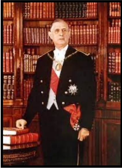
Charles de Gaulle, président français 1959-1969