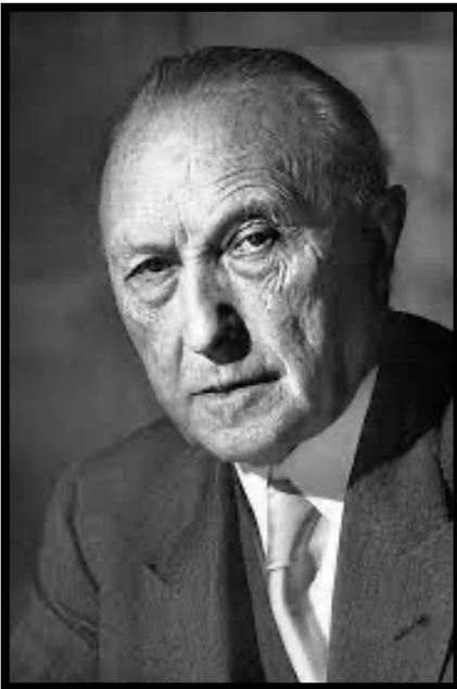
Konrad Adenauer, chancelier allemand 1949-1963

Ce 22 Janvier, nous fêtons les 60 ans du traité d'amitié franco-allemand. Nous avons donc choisi de vous présenter ce traité, ainsi que ce qu'il implique.